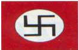
Bandera Oficial del tercer Reich. Tercer Reich.