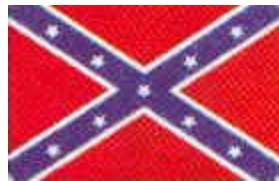
Bandera del Impaerio

Para volver a la página principal, pulsa el botón de atrás o anterior.