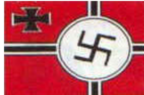
Bandera de combate del