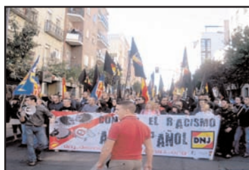
Usera (Madrid) 11.11.07