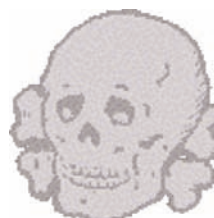
Emblema metálico de las gorras de las Waffen SS